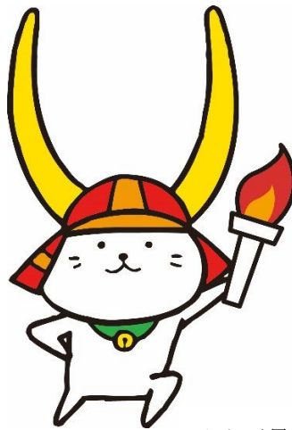
ひこにゃん国スポ・障スポ仕様【炬火】