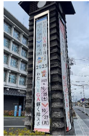
本庁舎広告塔懸垂幕