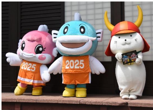
ひこにゃん誕生日会 (県・市でPR)