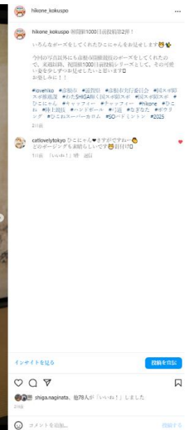
わた SHIGA 輝く国スポ 1000 日目の 1 月 2 日に投稿した内容