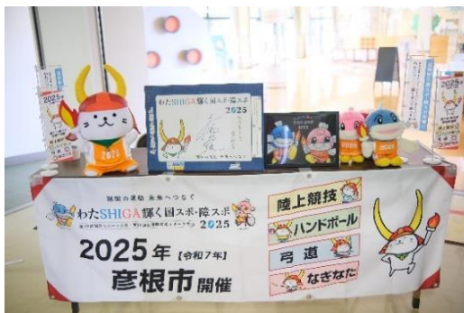
障害者スポーツカーニバル