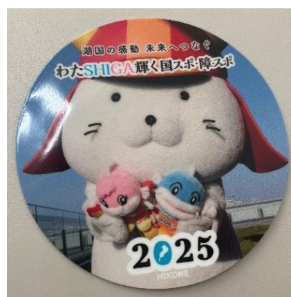
オリジナルステッカー