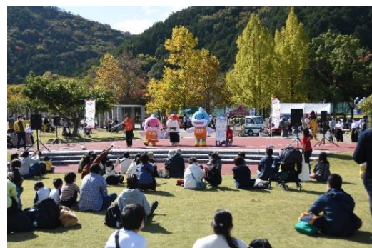
ひこねのいる文化祭