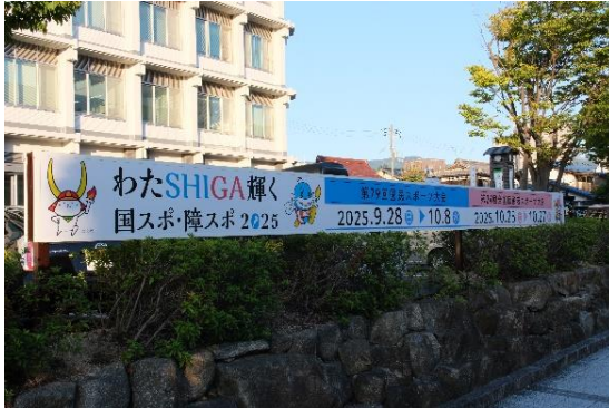
本庁舎正面駐車場看板