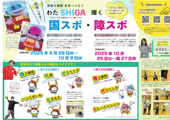
広報ひこね 1月号特集記事（1～2 ページ目）