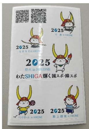
オリジナルシール